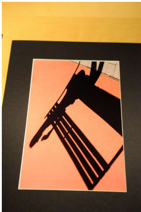
2. Mats Lönngren

Bild-bedömning: Knut Koivisto www.koivisto.se