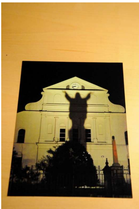
5 Benkt-Arne Philipson